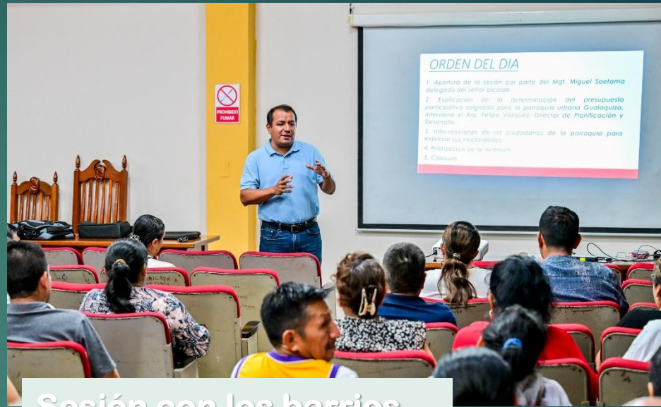
Sesión con los barrios