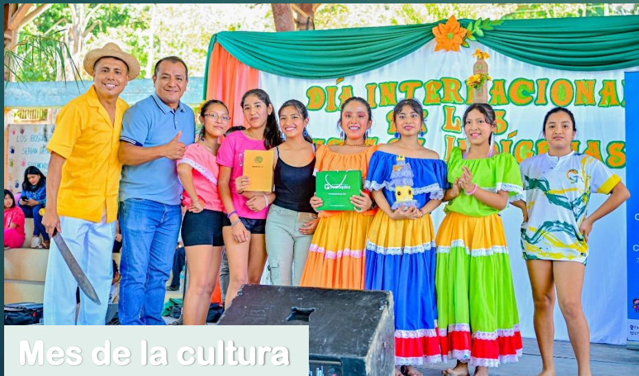
Mes de la cultura