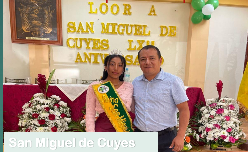
San Miguel de Cuyes