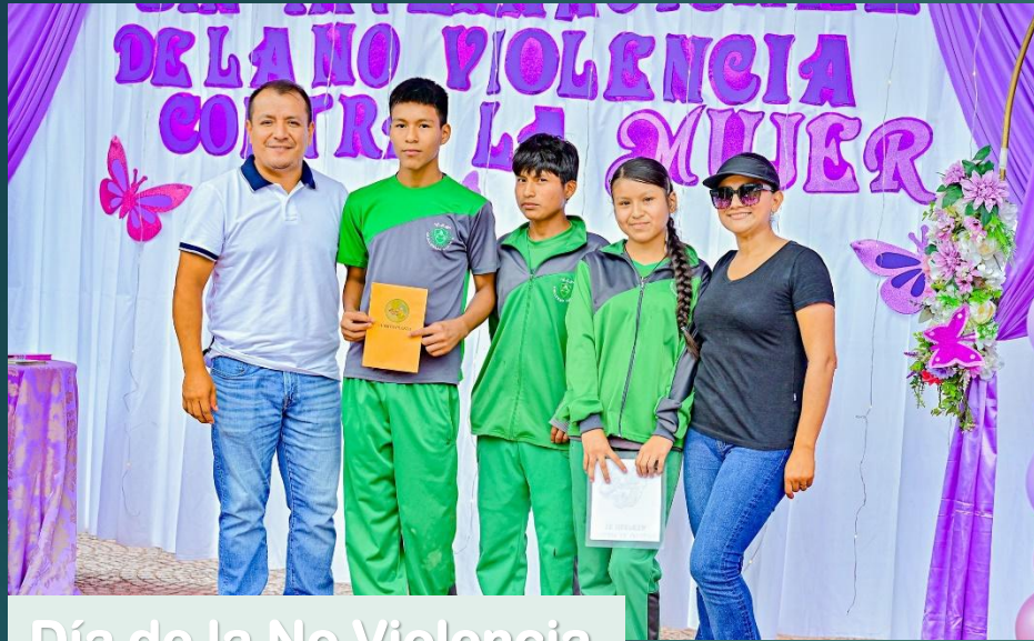
Día de la No Violencia