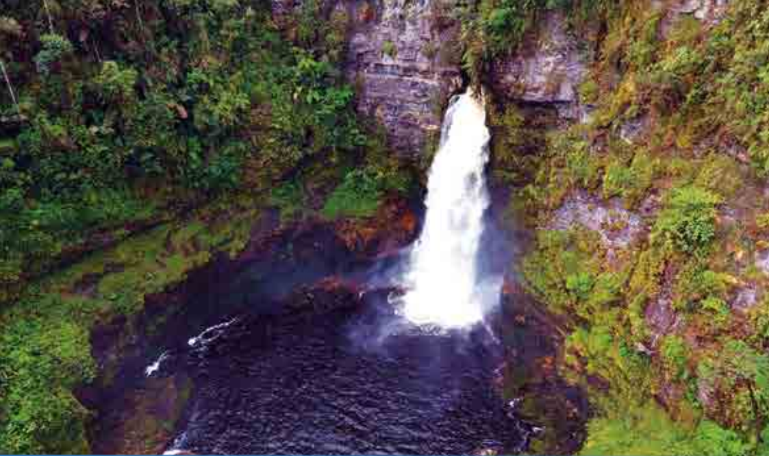
CASCADA “LA SAGRADA” - VALLE DEL QUIMI - GUALAQUIZA